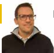
Assessore Luca Ferronato

Assessore ai Lavori Pubblici, Sviluppo Sostenibile e Politiche Sportive